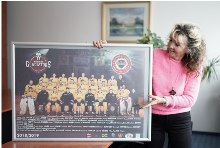
hokejový tím Gladiators