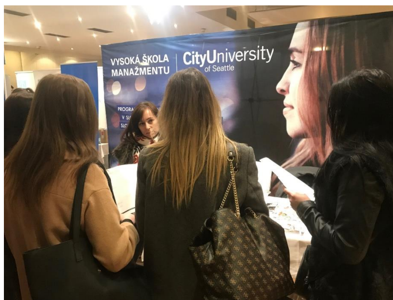
študijní poradcovia VŠM na RoadShow „Kam na vysokú“