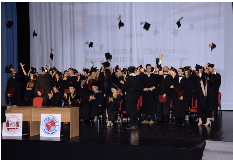
promócia absolventov VŠM, jún 2019