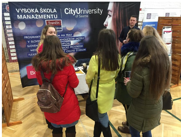
študijní poradcovia VŠM na RoadShow „Kam na vysokú“