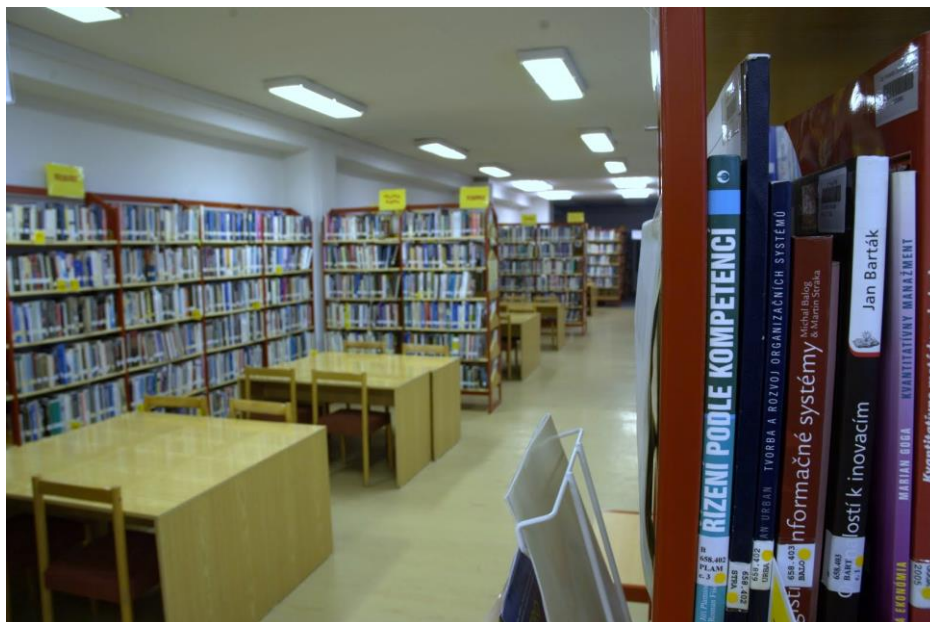
knižnica Vysokej školy manažmentu v Trenčíne