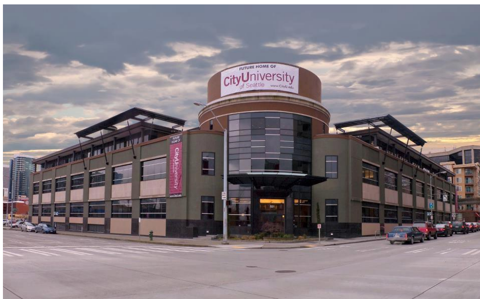
Sídlo centrály City University of Seattle v Seattle

Medzinárodná spolupráca Vysokej školy v pedagogickej oblasti sa opiera predovšetkým o spoluprácu so City University of Seattle v USA a partnerskými univerzitami v Európe, s ktorými buduje VŠM úzke vzťahy ako na úrovni programu ERASMUS, tak na vedecko-výskumnej úrovni.